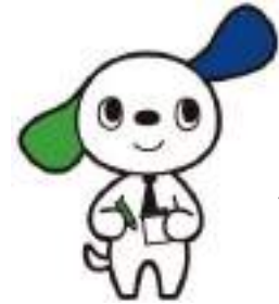
日刊工業新聞社 マスコットキャラクター ものたん®